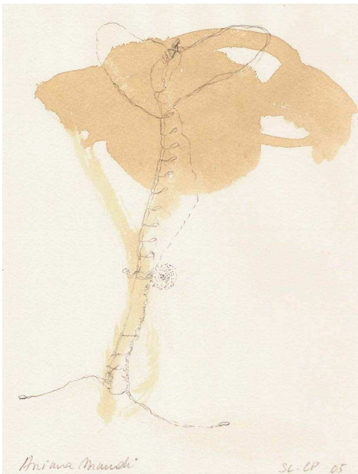
Œuvre originale en frontispice de Claude Panier